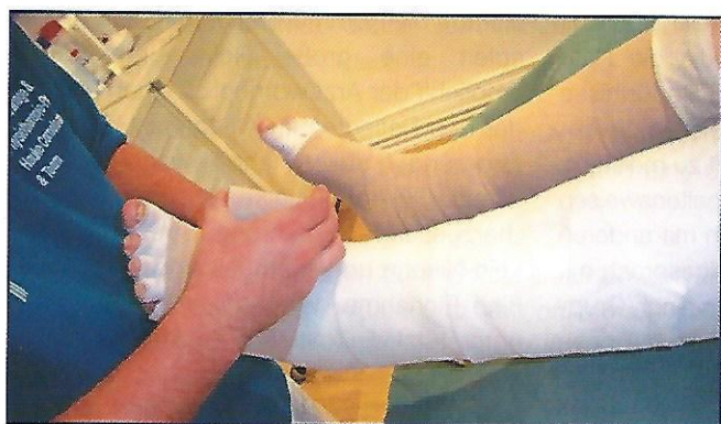
Die Wunde wird verbunden.

Besonders Patienten mit chronischen Wunden und einem Lymphödem sollten auf eine gesunde Ernährung mit viel frischem Obst, Salaten und Gemüse (Vitamine) achten. Eiweiße sind sehr wichtig für die Wundheilung. Daher sind Milchprodukte wie Joghurt sehr zu empfehlen.